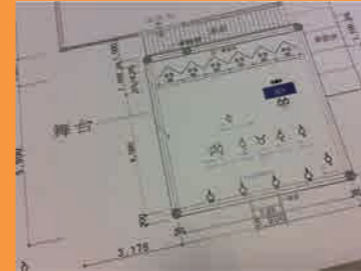
音響 仕込み図です