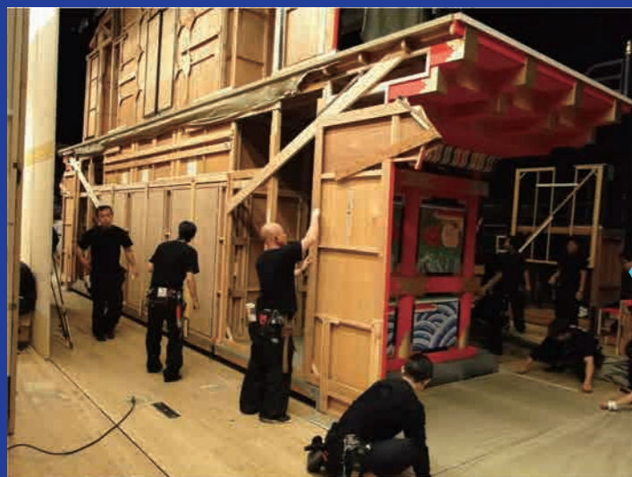
大道具(飾り方) 実際に劇場で組み立てていきます 舞台の転換も行います