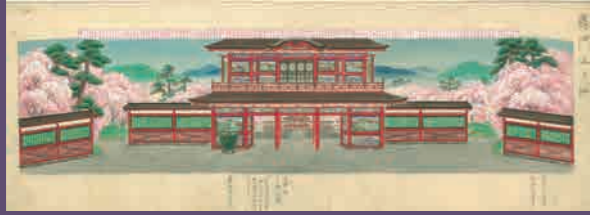
道具帳 舞台装置のデザイン画です