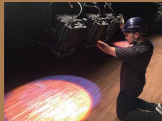
照明 照明の大きさや場所の調整(シュート)を行います