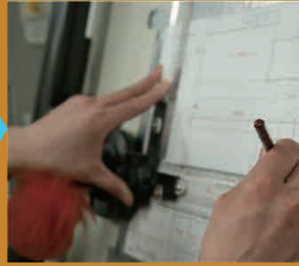
製図 道具帳から組み立て設計図を作成します