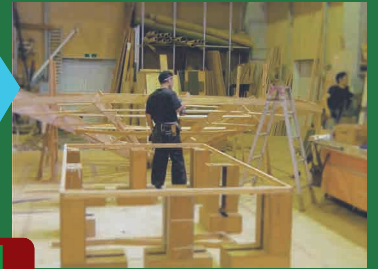
大道具(大工方) 設計図を基に造形物を作っていきます