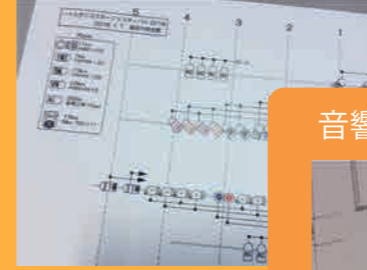
照明 仕込み図です